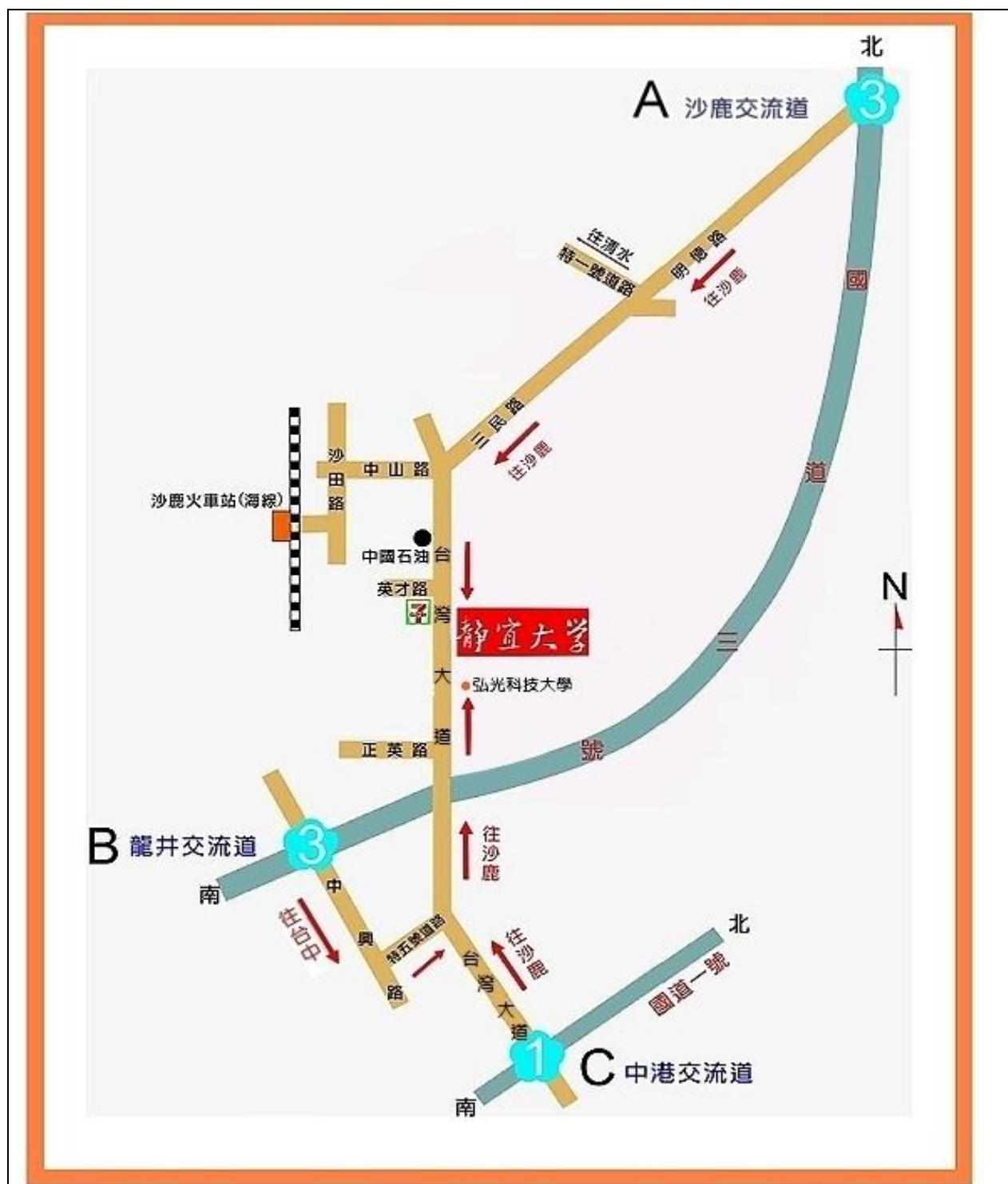
附錄：靜宜大學（臺中市沙鹿區臺灣大道 7 段 200 號）交通位置圖

備註：靜宜大學交通資訊，請參考該校網站 https://www.pu.edu.tw/p/404-1000-2733.php?Lang=zh-tw