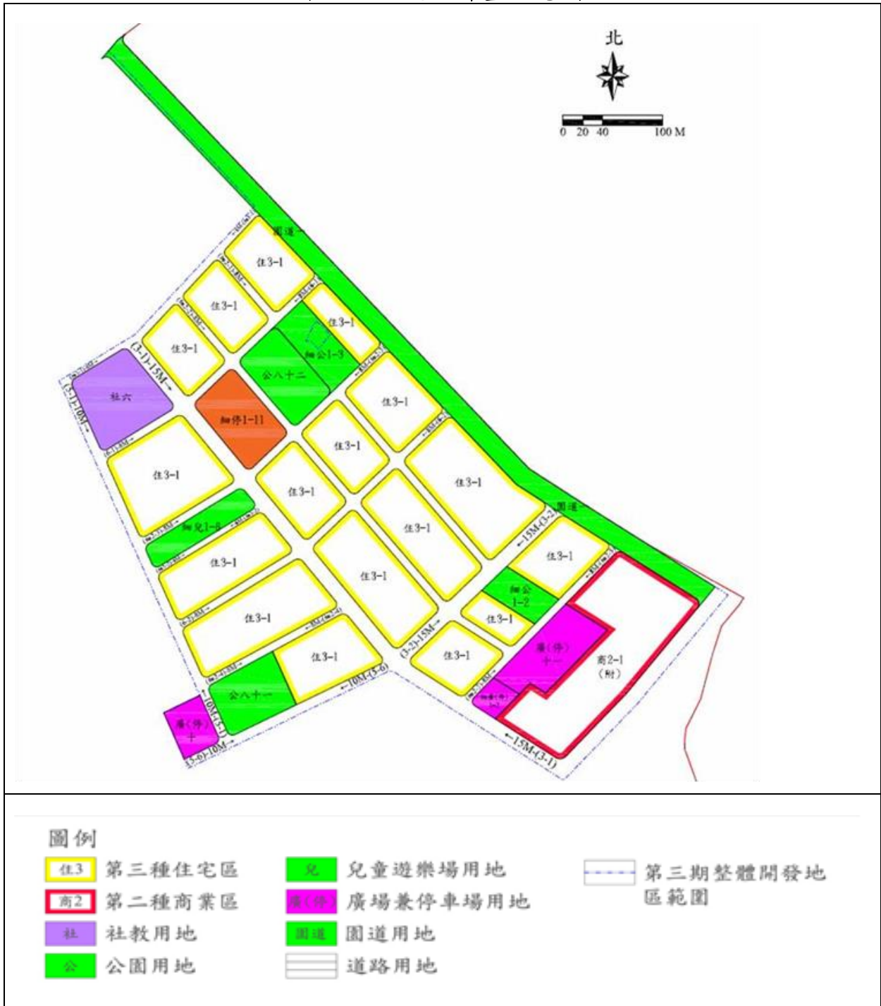
圖 2 土地使用計畫示意圖