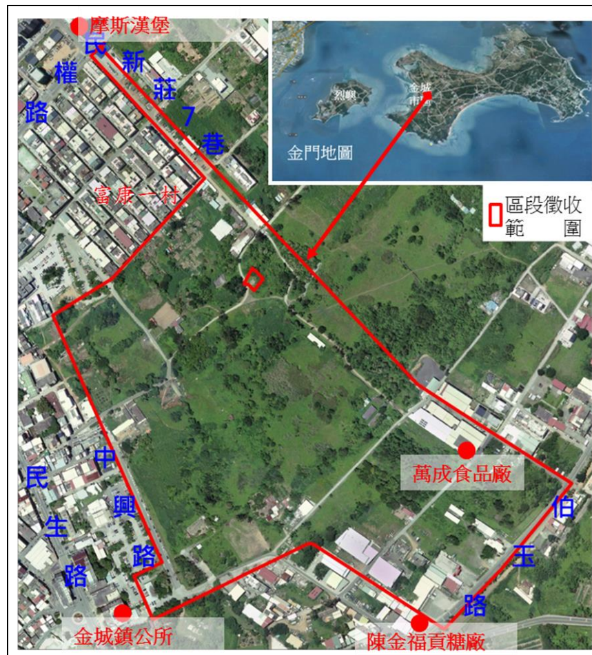
圖 1 區段徵收範圍正射影像圖

區內包含中一段、祥安段、北一段及旗牌段等土地，總面積約 20.13 公頃，其中私有土地面積約 16.99 公頃(占 84.41%)、公有土地面積約 3.14 公頃(占 15.59%)。