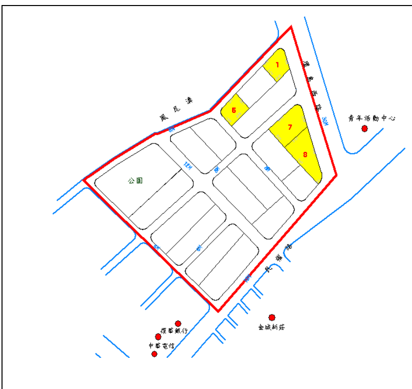
金城鎮第一期區段徵收土地 (第二次) 標售位置參考圖