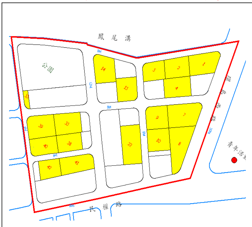
金門縣金城鎮第一期區段徵收標售土地位置參考圖